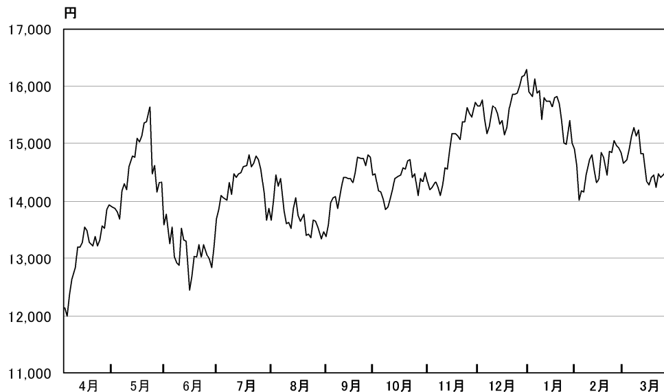
平成26年3月期累計期間の日経平均株価（終値）の推移

株式市場は、日銀の大規模な金融緩和策の導入を好感し上昇基調で始まり、日経平均株価（終値）は5月後半に15,600円台となりました。その後、中国経済の減速懸念や急速な株価上昇に対する警戒感の高まりから反落し、6月中旬には一時、12,400円台となりました。7月から10月は、米国の金融政策の動向を睨みながら神経質な展開が続き、日経平均株価（終値）は14,000円前後のボックス圏で推移しました。11月に入ると、米国の株価上昇や為替の円安進行に加え、米国における量的緩和の縮小決定による先行き不透明感の払拭を好感して上昇基調となり、日経平均株価（終値）は、12月30日に期中最高値（終値ベース）となる16,291円31銭を記録しました。1月以降は、中国など新興国経済の先行き懸念やウクライナ情勢の緊迫化を背景に、投資家のリスク回避姿勢が強まったことから軟調に推移し、3月31日の日経平均株価（終値）は14,827円83銭（前年度末比19.6%上昇）で取引を終えました。